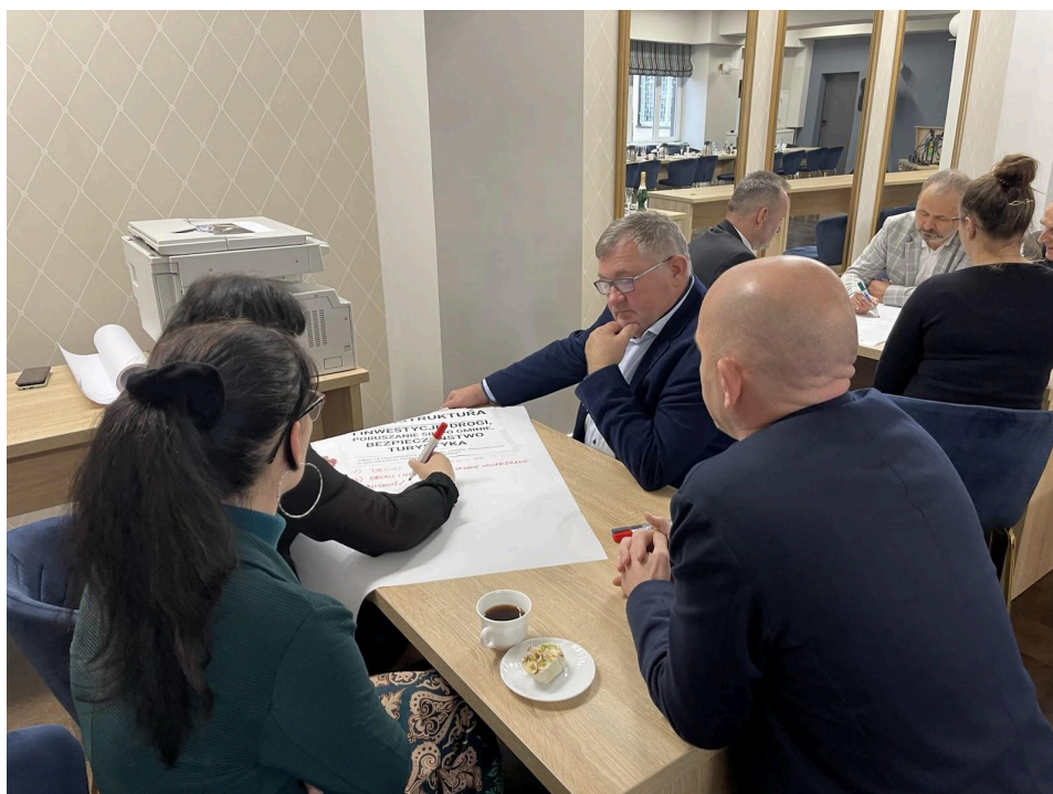
Zdjęcia z warsztatów konsultacyjnych 1 marca 2023 roku